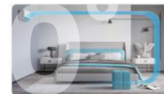
VERTIKÁLNE PRÚDENIE VZDUCHU