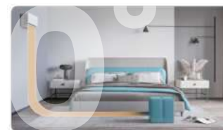
HORIZONTÁLNE PRÚDENIE VZDUCHU

Inovatívny 180° pohyb lamiel umožňuje prúdenie vzduchu v horizontálnom alebo vertikálnom smere. Táto možnosť vám umožní, aby nebol prúd vzduchu mierený priamo na vás.